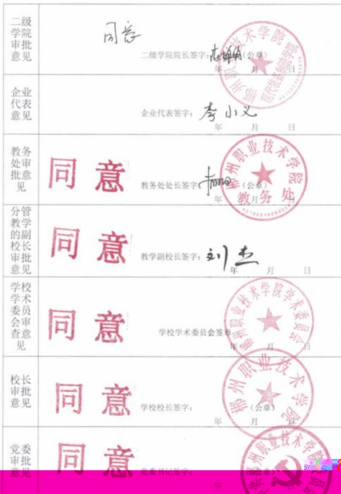
人才培养方案审批表