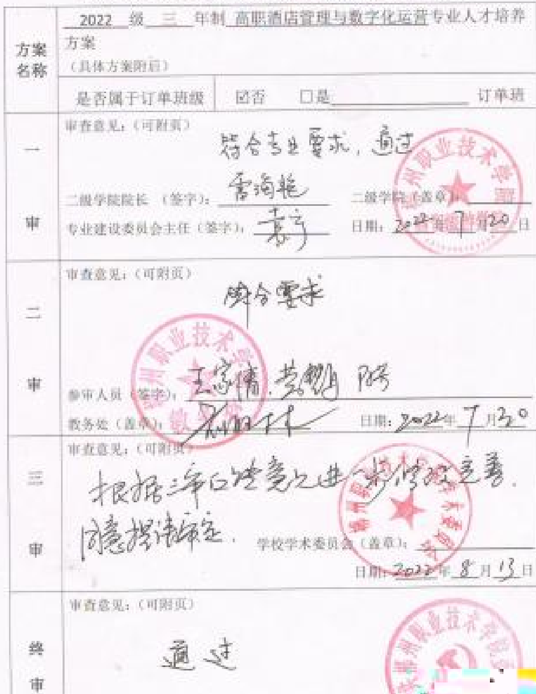
郴州职业技术学院专业人才培养方案制定审批表